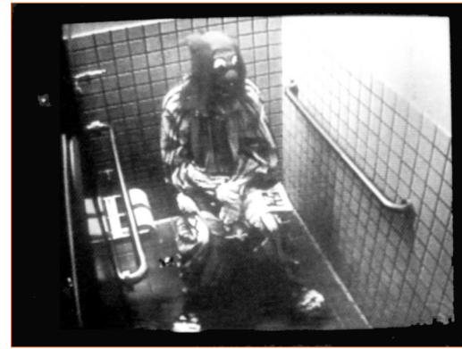
Bruce Nauman, Tortura del payaso , 1987

Catedrático de Historia del Arte en la Universidad de Friburgo. Especialista en arte español, entre sus libros destacan Breve historia de la sombra (Siruela, 1999), El ojo místico. Pintura y visión religiosa en el Siglo de Oro español (Alianza, 1996), La invención del cuadro: Arte, artifices y artificios en los orígenes de la pintura europea (Serbal, 2000) y El último carnaval: un ensayo sobre Goya (Siruela, 2000), escrito en colaboración con Anna María Coderch, en donde realizan un pormenorizado estudio sobre los significados de la risa en la obra del pintor.