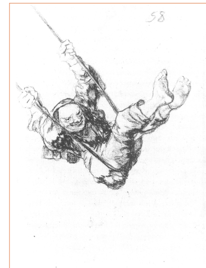
Goya, Viejo columpiándose , 1824-28

Convalidable por dos créditos de libre elección por la ULL y por la ULPGC