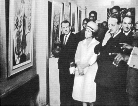
10. De dcha. a izda. Léopold Sédar Senghor, André Malraux y otros, en una exposición del Festival Mundial de las Artes Negras , Dakar, Senegal, 1966.