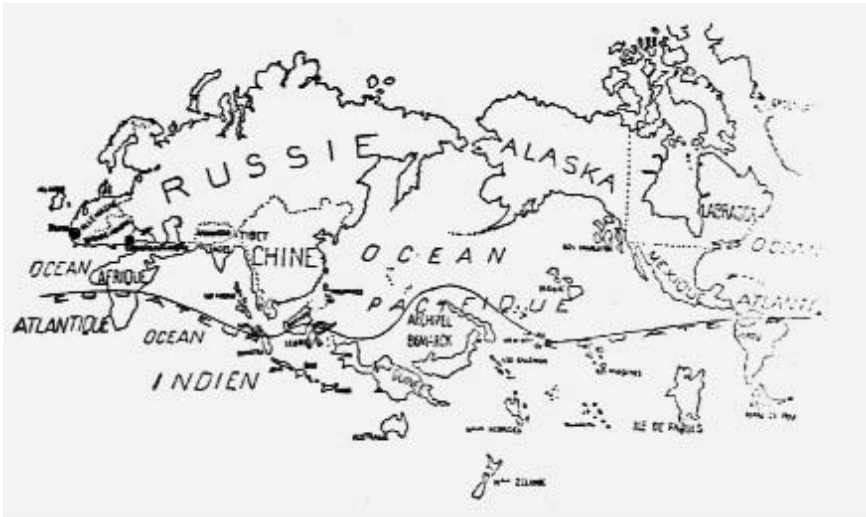
3. Mapa surrealista del mundo, Variétés , 1929.

El único abiertamente anticolonial 7 y el que lleva a cabo una de las más radicales críticas de la cultura europea del siglo XX, en la que coincide con la antropología, entonces inmersa en la tarea de definir sus límites. 8 Sin embargo, entre los surrealistas canarios no hay atisbos de una inquietud semejante. ¿Cómo entender su mutismo sobre África? Las explicaciones inmediatas resultan en exceso obvias: la asimetría intelectual entre Canarias y París en los años treinta es abismal y, en concreto, en materia de antropología las Islas tienen aún mucho terreno que recorrer. 9 El grupo surrealista canario es además más joven y mucho más reducido que el francés, del que es subsidiario. Sin embargo, pese a lo mucho que los separa, los surrealistas canarios son ca-