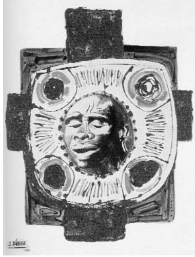
11. Pepe Dámaso Tríptico de la Crucifixión negra (detalle), técnica mixta sobre papel, 1966.

fue concebido como un encuentro de “defensa y celebración de la negritud”. 24 No en balde Senghor fue, junto al martiniqués Aimé Césaire y al guayanés Léon-Gontrand Damas, uno de los progenitores de aquel movimiento de reivindicación del genio “negro” surgido en el París de la “crisis negra” y que el presidente-poeta evoca en la inauguración del Festival con invocaciones a Apollinaire y Picasso. Jefes de Estado, diplomáticos, etnólogos, historiadores y lingüistas compartieron fervor ex colonial con creadores africanos y afroamericanos como el citado Césaire. Éste puso en escena su drama La tragedia del rey Christophe 25 con músicos como Marion Williams y Duke Ellington, con cineastas como Sembène Ousmane y con escritores como Wole Soyinka y Langston Hughes congregados en un simposio sobre “artes negras” junto a homólogos europeos como Michel Leiris, que regresaba a Dakar, ahora como director del Museo del Hombre de París, y André Malraux, ministro francés de Asuntos Culturales. No obstante, el centro de gravedad del encuentro lo constituían dos exposiciones: una sobre la evolución del arte “negro” que arrancaba de Egipto, reivindicado como madre de las civilizaciones “negras”, y otra de artistas contemporáneos de Costa de